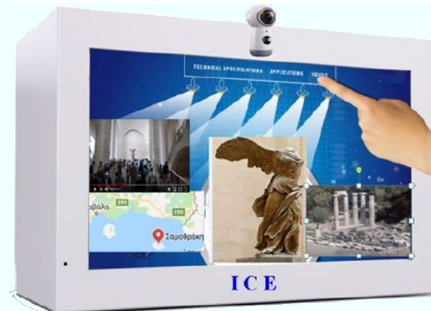
Το προτεινόμενο σύστημα ICE

Το τελικό προϊόν θα απευθύνεται σε εκθεσιακούς, εκπαιδευτικούς και άλλους χώρους, με δυνατότητα παροχής ολοκληρωμένης υπηρεσίας παρουσίασης εκθεμάτων, με δυναμικό περιεχόμενο που θα προσαρμόζεται στις προτιμήσεις, τις ανάγκες και το προφίλ των χρηστών, μέσω συστήματος διαχείρισης γνώσης.